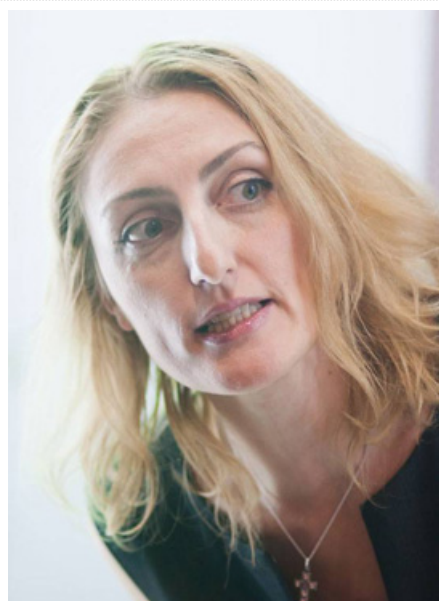
Наринэ Абгарян

Считается, что писать для детей — это то же самое, что писать для взрослых, только лучше. На практике, увы, получается, что писать для детей — это то же самое, что писать для взрослых, только хуже.