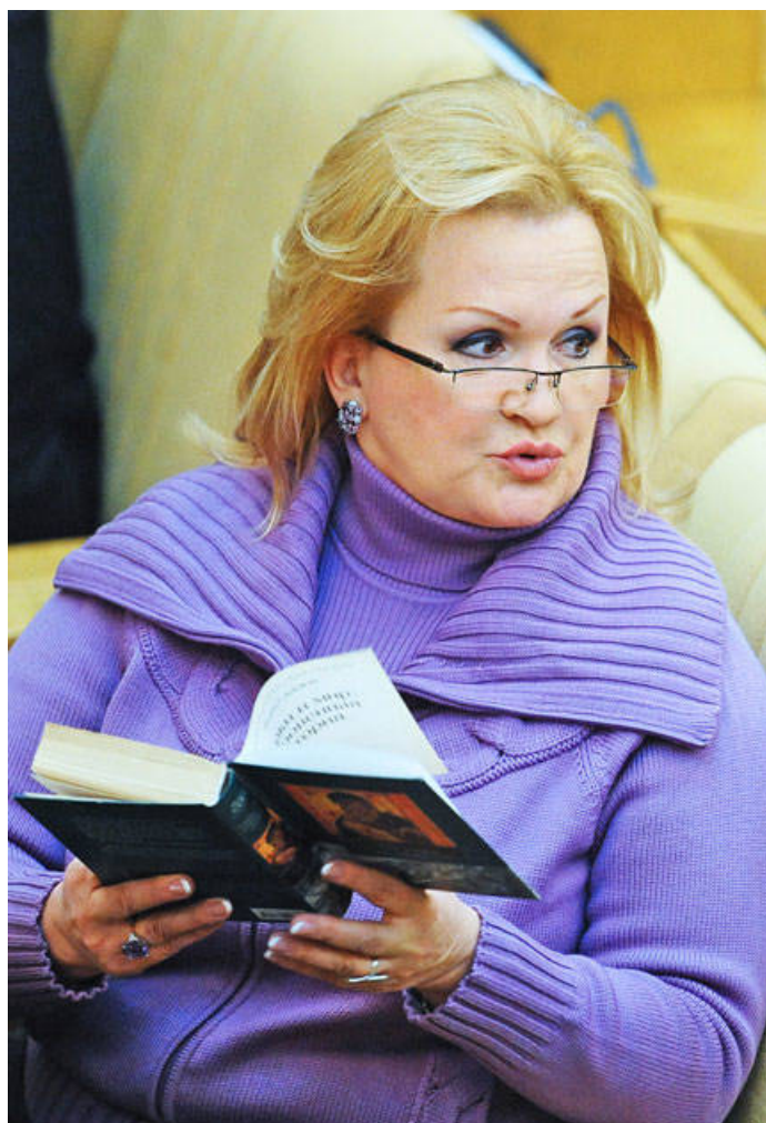
Любовь Слиска (депутат Госдумы РФ III, IV, V созыва).