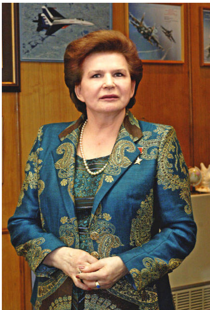
Валентина Терешкова (первая женщина-космонавт, депутат Государственной думы VI созыва от партии «Единая Россия», заместитель председателя комитета Госдумы по международным делам)