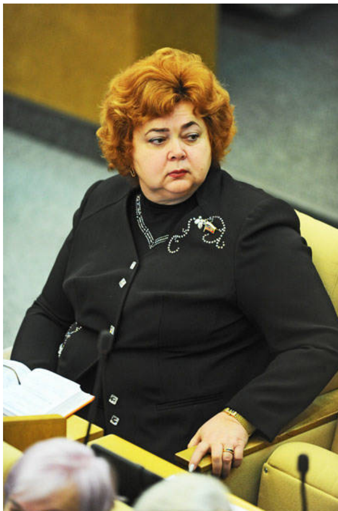
Надежда Шайденко (депутат Госдумы РФ VI созыва от партии «Единая Россия»).