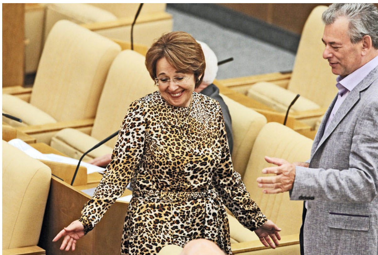
Оксана Дмитриева (заместитель руководителя фракции «Справедливая Россия» в Госдуме России,