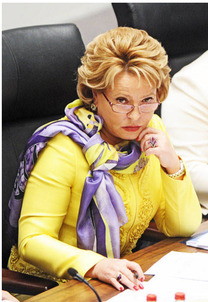
Валентина Матвиенко (председатель Совета Федерации РФ).