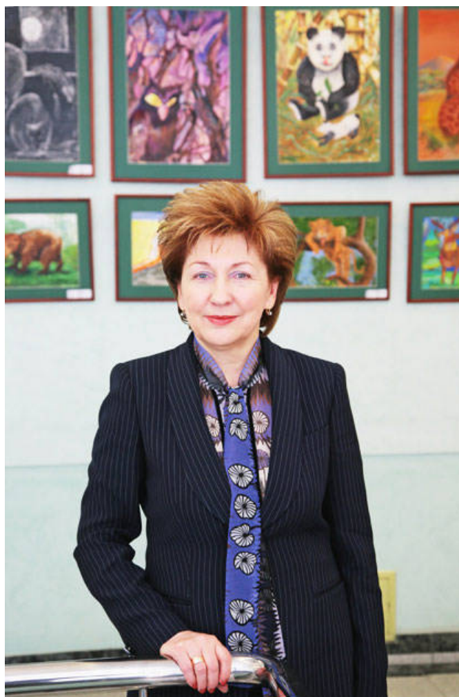
Галина Карелова (депутат Госдумы ФС РФ, член Генсовета партии «Единая Россия»)