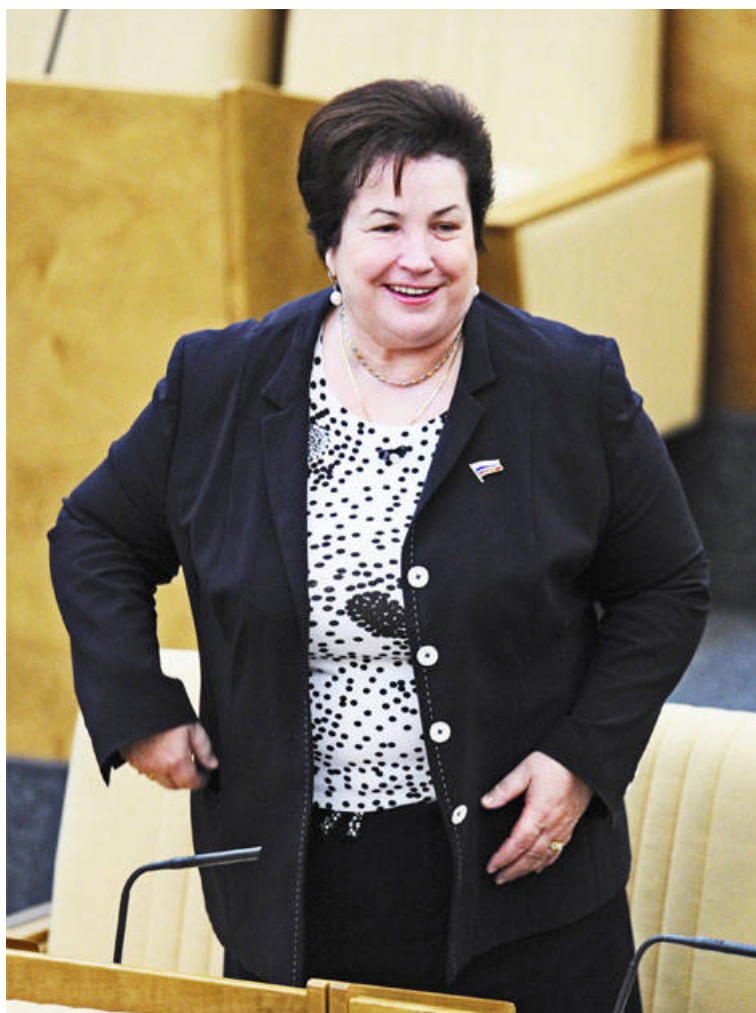
Валентина Кабанова (депутат Госдумы РФ VI созыва от партии «Единая Россия»)