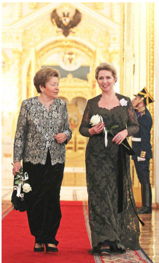
Наина Ельцина (вдова первого президента России Бориса Ельцина) и Светлана Медведева (жена премьер-министра Дмитрия Медведева).