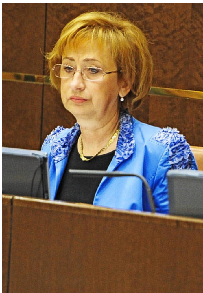
Лариса Пономарева (член Совета Федерации от Чукотского автономного округа).