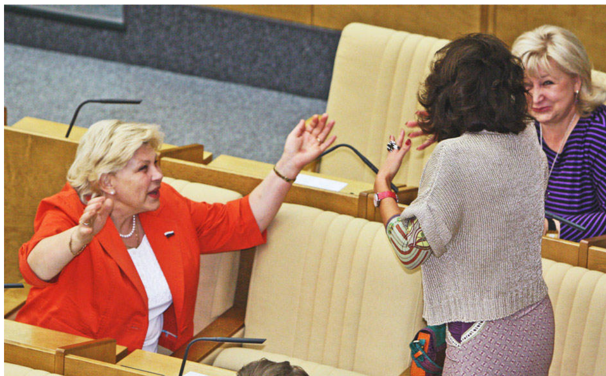
Елена Драпеко (советская и российская актриса театра и кино, в Госдуме IV созыва входила во фракцию «Справедливая Россия — "Родина"»), Алла Кузьмина (депутат Госдумы 5 и 6 созывов от партии