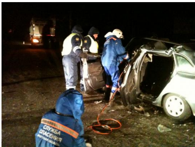
Фото: пресс-служба ГУ МВД по Иркутской области

Автор: Сергей Александров © Babr24.com ПРОИСШЕСТВИЯ, 👁 5945 16.01.2013, 18:17 📄 1020 URL: https://babr24.com/?ADE=111360 Bytes: 2438 / 1994 Версия для печати Скачать PDF