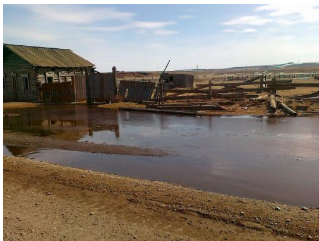
Процветающая православная деревня Анга

нормальные дороги, новы рабочие места, множество социальный объектов, которые здесь попросту отсутствуют.