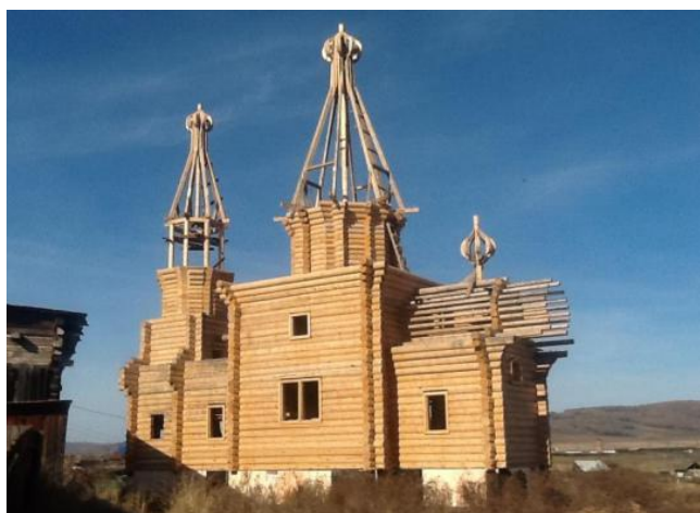
Для епархии депутат Тен денег не жалеет

В ходе поездки в Ангу выяснилось, что Тен строит в деревне большой деревянный храм , расположенный «рядом с домом где родился Святитель Иннокентий». Народный избранник сыплет остросюжетными подробностями: «В Ангу приезжают паломники, в том числе из США. Икону на английском языке подарил дому-музею индейский вождь Черный Ворон».