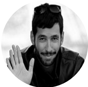
Автор текста: Андрей Темнов , независимый журналист.

На сайте опубликовано 1065 текстов этого автора.