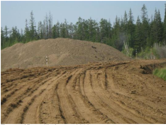
Трасса `Вилюй`. Август 2012 года.