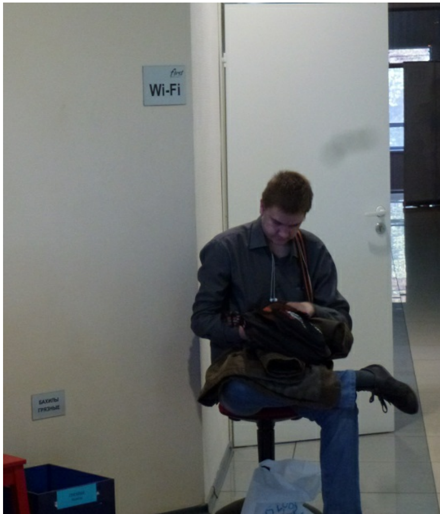
Заветное место, где ловится Wi-Fi.