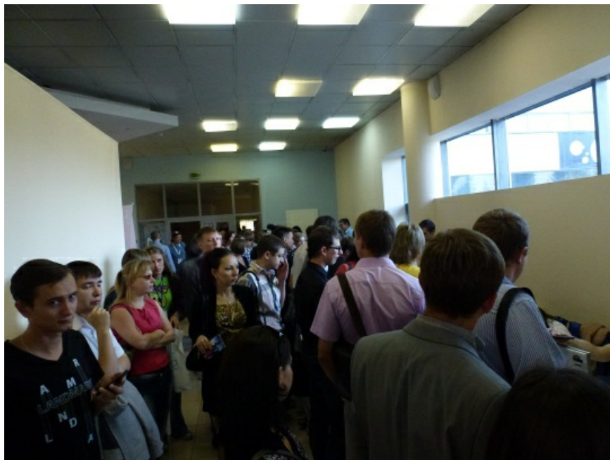
Через 30 минут после официального начала форума. Очередь не стала меньше.