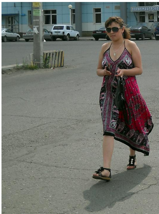
А девушки - как и везде: красивые.

Туалетная философия по-нижеудински. Здесь клозет называют `Санитарно-бытовой комнатой`.