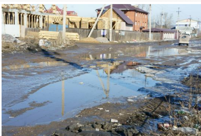
ул. Челябинская, 43