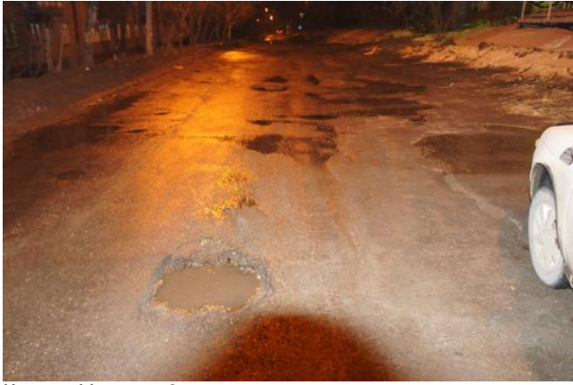
Клары Цеткин, 8