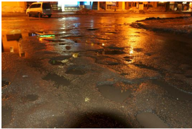
Октябрьской революции, 17