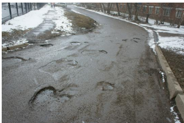
Александра невского, 25

Сегодня дороги Иркутска это скорее направления, нежели подходящие для комфортного передвижения транспортные магистрали. Чтобы в этом убедиться достаточно просто выйти на улицу. Или посмотреть на приведенные ниже фотографии.