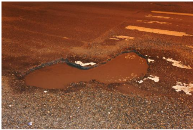
ул. 2-ая Железнодорожная