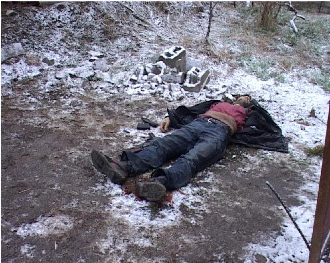
КТО в Дагестане 1 февраля 2011 года.