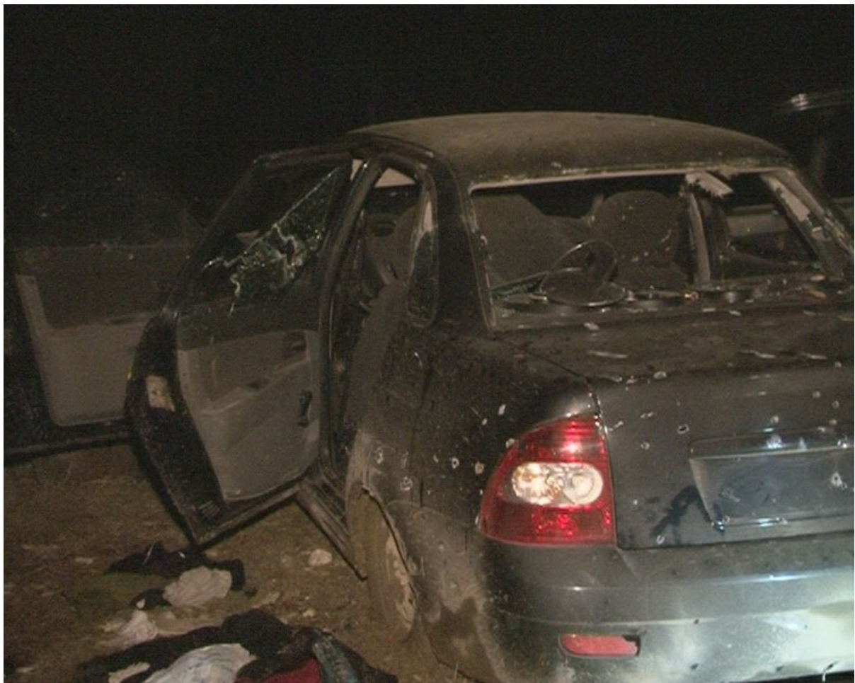
КТО в Махачкале 12 декабря 2011 года.