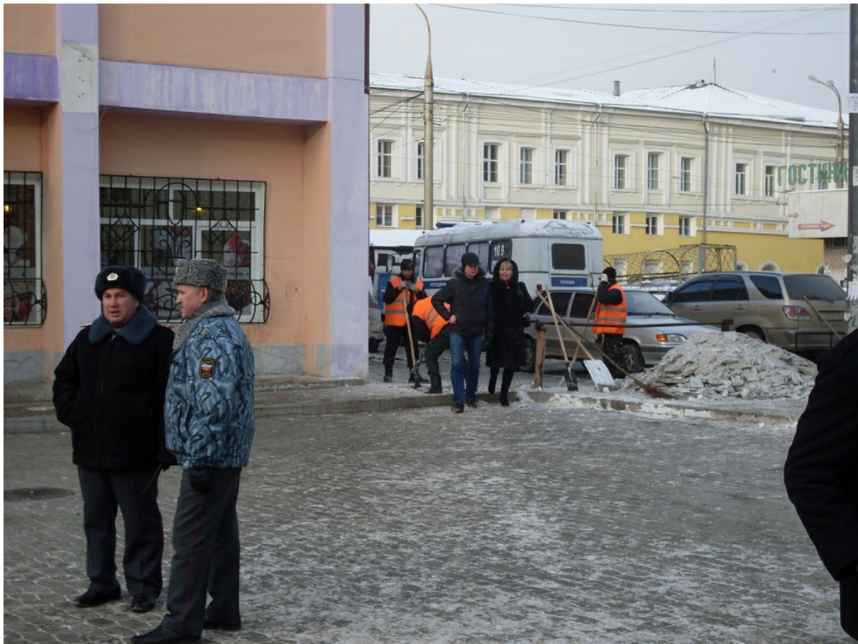
Полиция не вмешивалась.